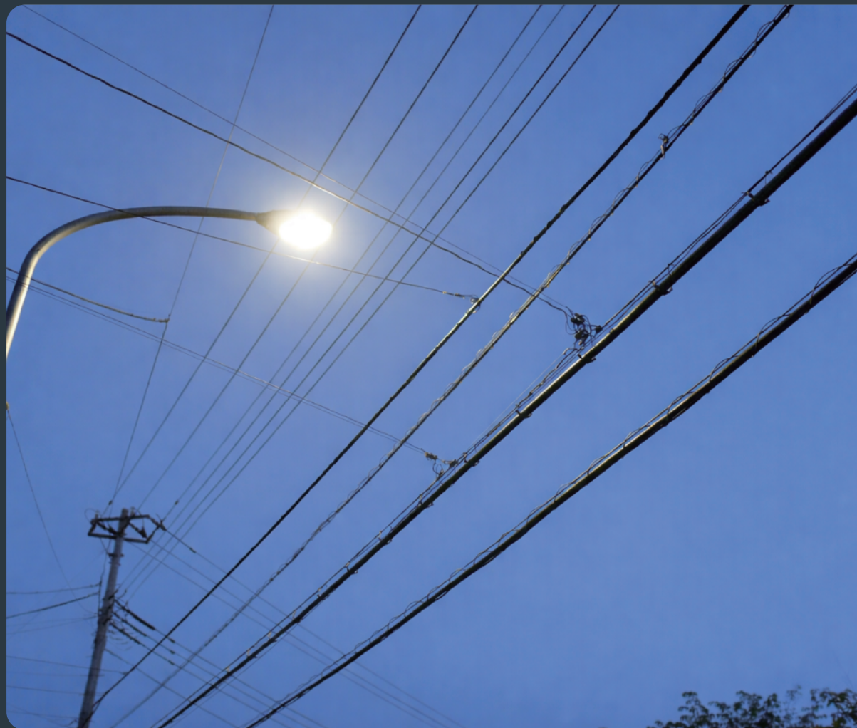
【手術前】視力0.7：暗い環境で光がぼやけない