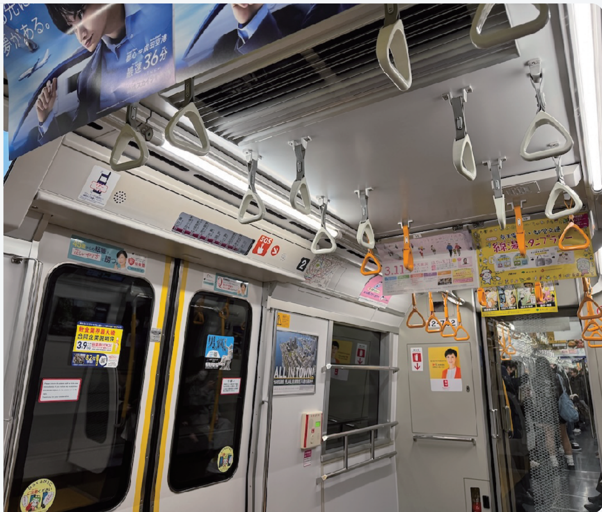
【手術後】視力1.5：遠くにある文字もハッキリと見える