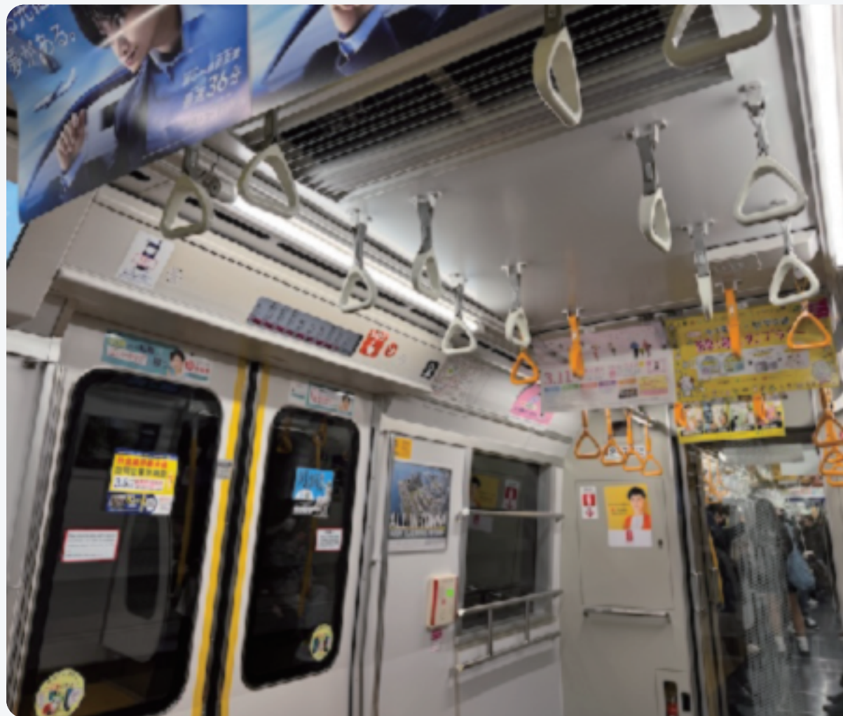
【手術前】視力0.7：近くはハッキリ見えるが数m先がぼやける