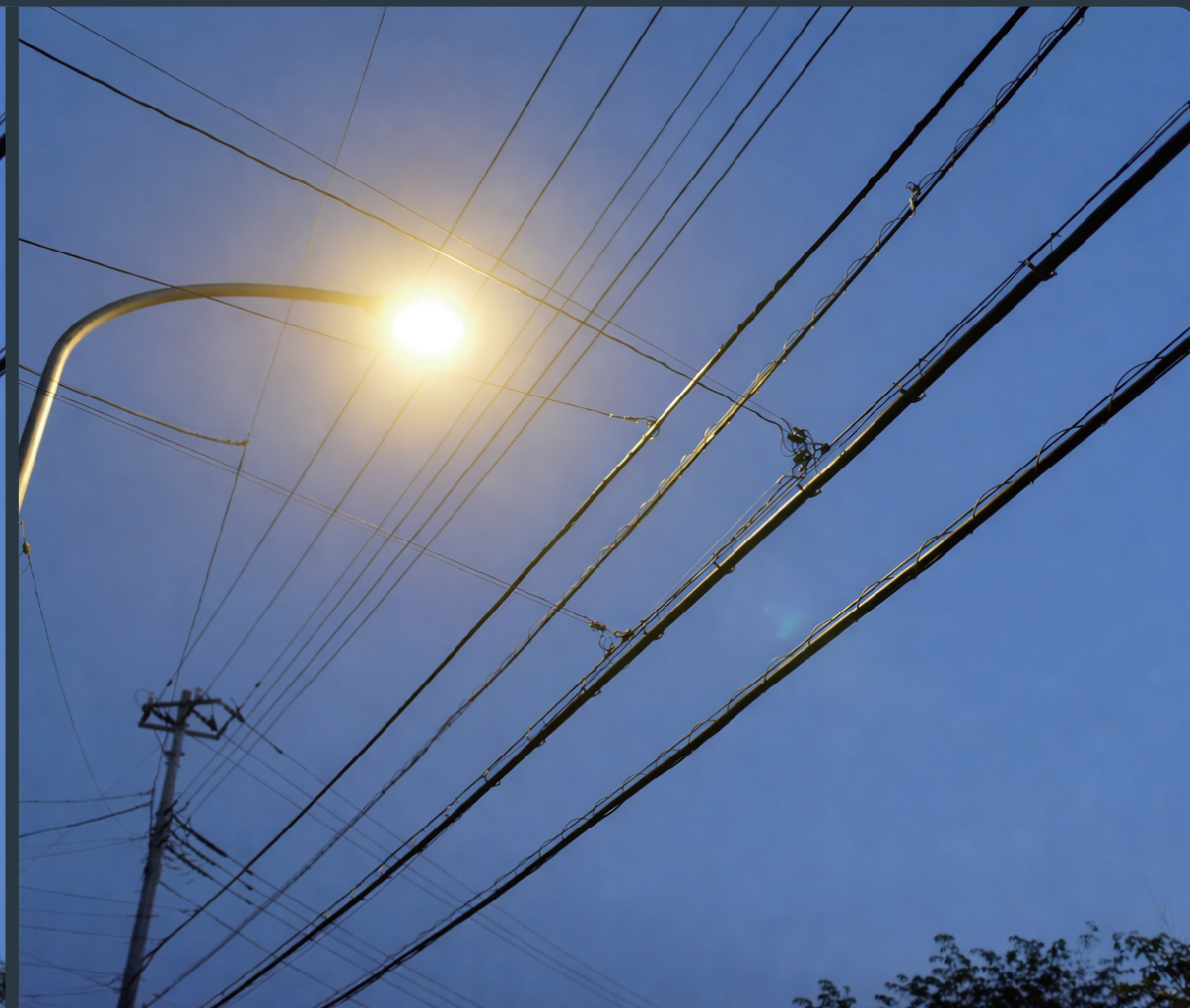
【手術後】視力1.5：暗い環境で光がぼやけ、眩しく感じる (ハロー・グレア現象)