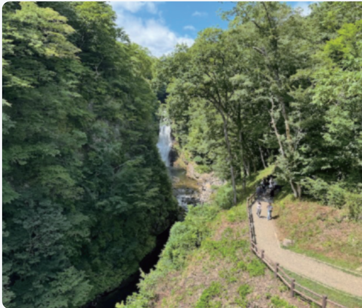
【手術前】視力0.7：少しボヤけて見える