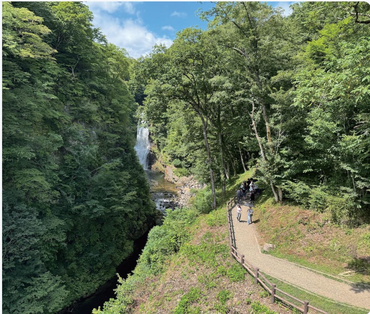
【手術後】視力1.5：遠くまでハッキリ美しく見える